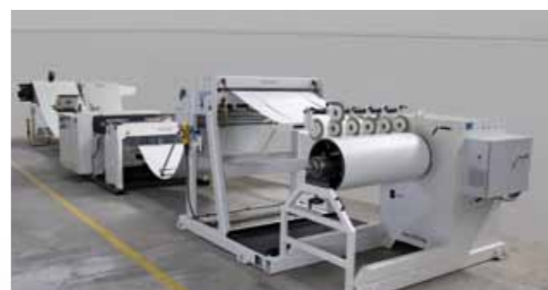
Linky pro odvíjení, podélné dělení a navíjení svitků plechu