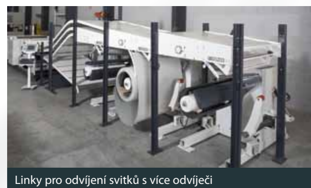
Linky pro odvíjení svitků s více odvíječi