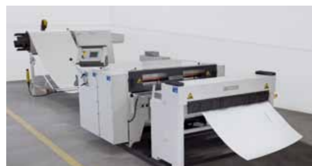
Linky pro rovnání, podélné a příčné dělení plechu ze svitků

S linkou na zpracování plechů ze svitků od společnosti Forstner si můžete být jisti optimální flexibilitou, již jako výrobní firma oceníte.