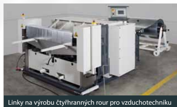
Linky na výrobu čtyřhranných rour pro vzduchotechniku